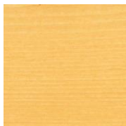
410 Бесцветное шелковисто- матовое